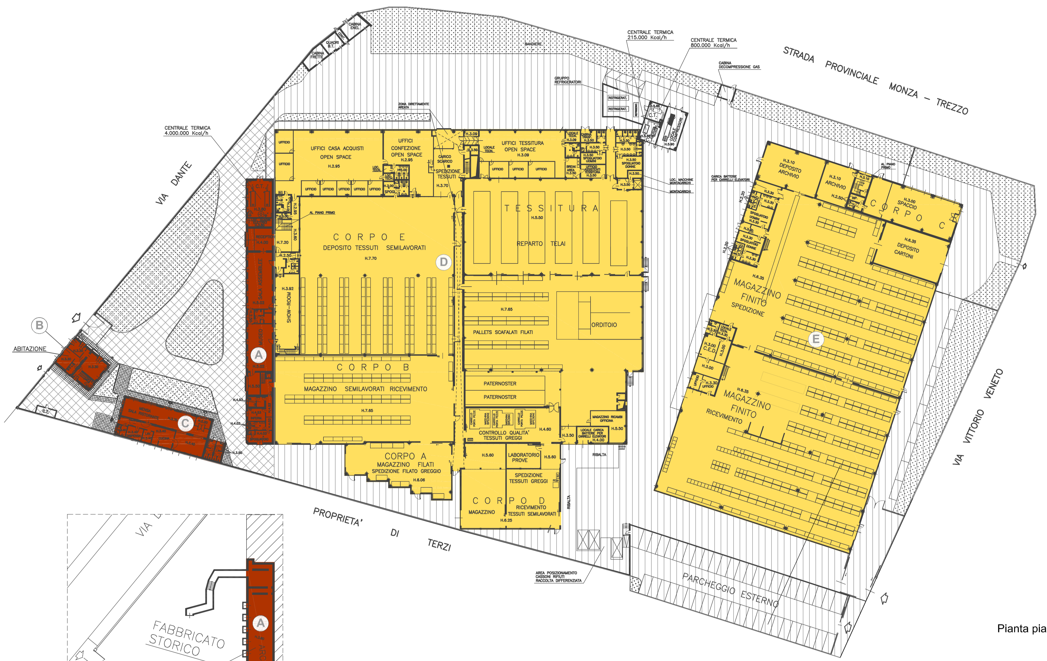
Pianta piano terra